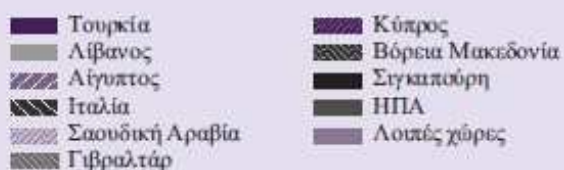
Διάγραμμα Γ Προορισμοί ελληνικών εξαγωγών διυλισμένου πετρελαίου

Σημείωση: Μέσοι όροι πέντε τελευταίων ετών (2014-18).